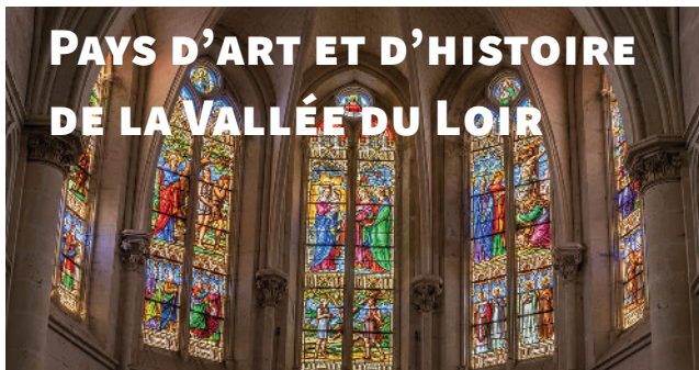
Les verrières du chœur - église de Mayet