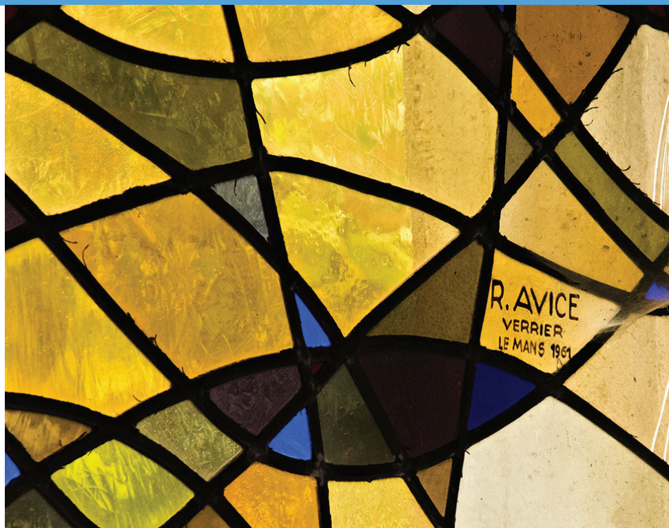
Vitral de la Chapelle Gaguain © Pierre-Bernard Fourny.