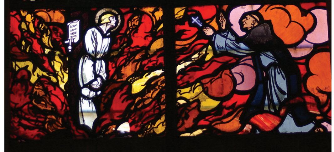
Vitrail de Jeanne d'Arc - Cathédrale du Mans.

Des jumelles vous seront prêtées lors des visites guidées des vitraux de la cathédrale, si vous n'en possédez pas.