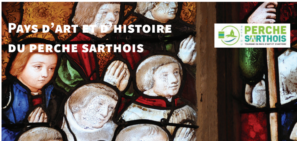
Détail d'un vitrail Renaissance restauré au XIX e siècle, église Notre-Dame-des-Marais, La Ferté-Bernard.