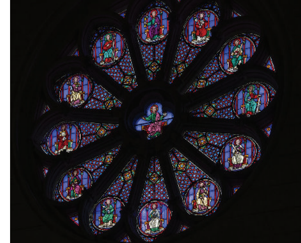
Rose des Apôtres et le Christ enseignant. Église de Mayet.

Samedis 18 avril et 25 juillet de 14h à 18h