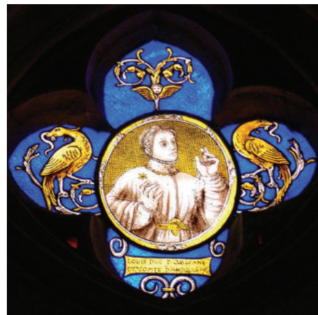
Vitrail de la chapelle Saint-Lyphard à La Ferté-Bernard, fin du XX e siècle. Cemjika-Perche Sarthois

→ Rendez-vous devant l'église Notre-Dame-des-Marais, place Carnot à La Ferté-Bernard.