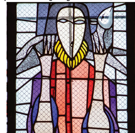
Détail du vitrail du Bon Pasteur, vers 1990, église de Vancé.